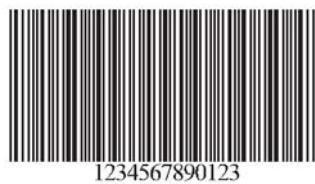
Izgled bar - koda za vozila